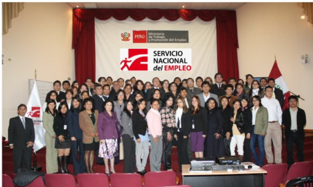
Funcionarios de las DRTPE y Consultores de Empleo de las oficinas SENEP, junto con el personal de la Dirección General del Servicio Nacional del Empleo.

El Servicio Nacional del Empleo del Ministerio de Trabajo y Promoción del Empleo de esta manera reafirma el compromiso de trabajar de manera descentralizada, ampliando la cobertura y poniendo